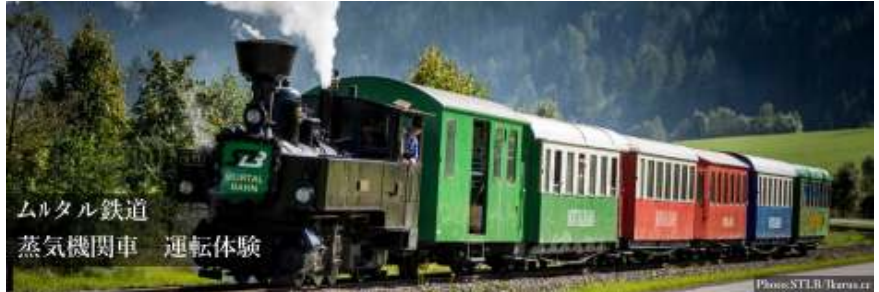
ムルタル鉄道 蒸気機関車 運転体験