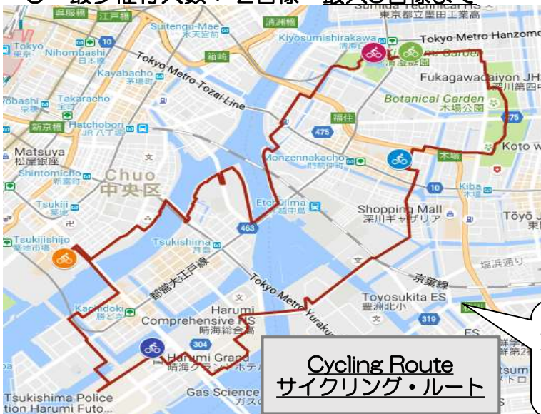
Cycling Route サイクリング・ルート