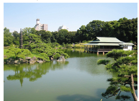
Famous Japanese stroll garden built by Y. Iwasaki, a founder of Mitsubishi 三菱の創業者の岩崎弥太郎が整備した日本の代表的な回遊式林泉庭園