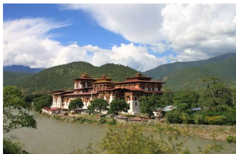
美しいプナカ・ゾン