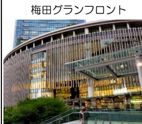
梅田グランフロント

弊社お馴染みの 現地集合・現地解散型 ツアー! 3日間とおしても、 1日だけでも、 皆さまのご希望で自由に 選択いただけます!