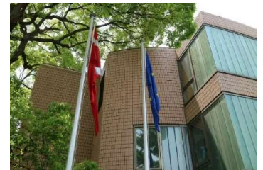
デンマーク大使館