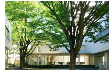
↑ ヒルサイドテラス