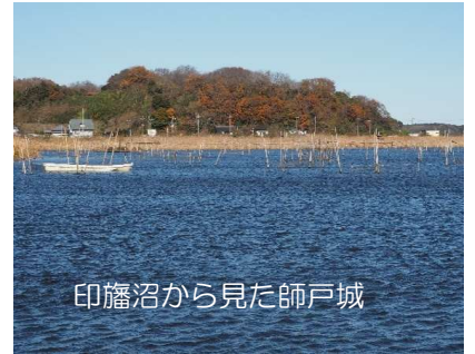
印旛沼から見た師戸城

師戸城には、天守や櫓はおろか、石垣すらありません。 土を掘って、盛り上げただけの「土の城」です。 戦国時代には、こんな「土の城」が日本全国に何万か所も築かれました。 戦国の「土の城」は、パッと見はタダの山か雑木林。 しかも、いつ誰が築いたのか、わからないことがほとんどです。 でも、いま、そんな戦国の「土の城」にハマる人が続出中！ ハマるたちは、口をそろえてこう言います。「 土の城の方が、生々しい! 」 何がそんなに生々しいのでしょうか？ 名も知らぬ武将や兵士たちが、命がけて築いて、しがみついていた「土の城」。 あなたも現地で「戦国の風」を感じてみませんか？