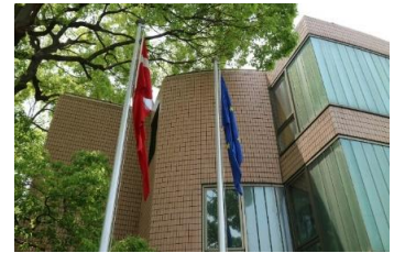
デンマーク大使館