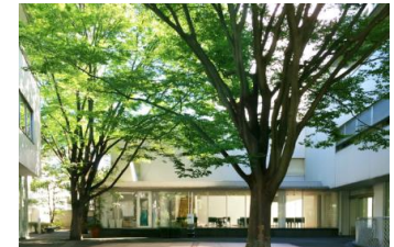
↑ヒルサイドテラス