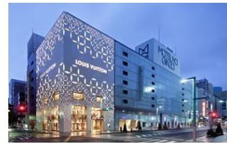
↑ルイ・ヴィトン/松屋銀座